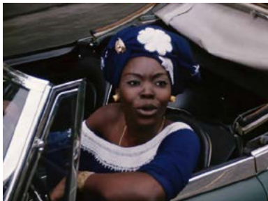
Safi Faye © Petit à Petit de Jean Rouch, 1971

Découvrez en salle une sélection de films d'Afrique, d'Amérique Latine et d'Asie, deux réalisatrices aux œuvres essentielles, Safi Faye, pionnière au Sénégal et Ann Hui, prolifique cinéaste hongkongaise, une traversée du cinéma vietnamien et des succès du cinéma populaire indien. Et, à l'espace Cosmopolis, Le 3 Continents Café vous accueille avec ses rencontres, exposition et soirées festives.