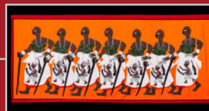
La danse Gnifossisso - Yves Pèdé - 2018