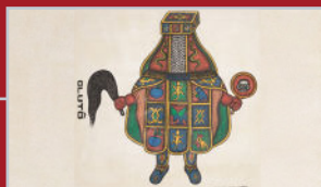
Clutô - Cyprien Tokoudagba