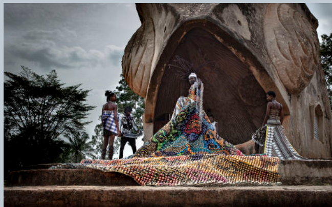
Yahocha - Eric Bottero - 2022 © Eric Bottero

Trois associations partenaires, La Maison de l'Afrique à Nantes , Des Unes Aux Autres et Bénois et Amis de Nantes , coproduisent ce projet avec le soutien de la Galerie Vallois , faisant le pari que « La connaissance est le prélude à la reconnaissance et à la fraternité ».