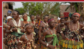
Fête du Vodun - Charles Placide - 2009 © Charles Placide