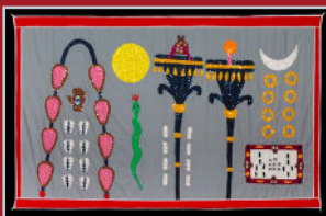
Asen - Yves Pèdé - 2010 © JY Augel