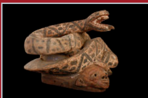
Masque Gèlèdè