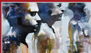
Le désespoir des racines - Bruce Clarke - 2023 © Bruce Clarke